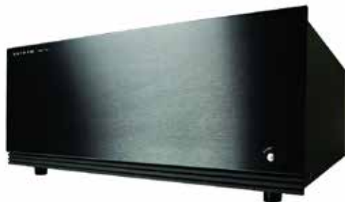
waga netto: 18.6 kg wymiary produktu: 438 x 178 x 310 mm