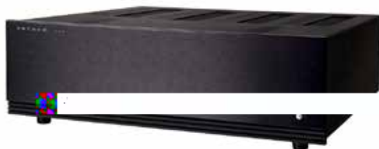
waga netto: 21.6 kg wymiary produktu: 438 x 149 x 420 mm