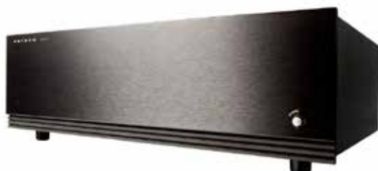
waga netto: 21.5 kg wymiary produktu: 438 x 135 x 420 mm